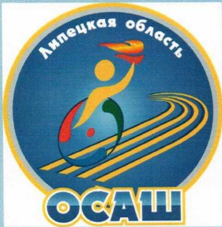
Областное бюджетное учреждение «Областная спортивно-адаптивная школа»